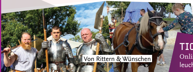
Von Rittern & Wünschen

Wir feiern den Internationalen Kindertag mit einem tollen Programm! Schaukämpfe um 11, 13, 15 & 17 Uhr